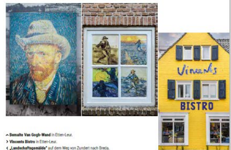
▲ Bemalte Van Gogh-Wand in Etten-Leur. ➤ Vincent's Bistro in Etten-Leur. ◀ „Landschaftsgemälde“ auf dem Weg von Zundert nach Breda.

Vincent van Gogh (1853–1890) wurde in Brabant geboren und hat die meiste Zeit seines Lebens in der Region gelebt und gearbeitet. Er liebte die Landschaft und fand hier Inspiration. Wir starten in Breda, der drittgrößten Stadt Brabants. In der prunkvollen „Grote Kerk“ war Vincent van Goghs Großvater Pfarrer. Sehenswert sind die Renaissance-Grabmäler, in denen die Ahnen der niederländischen Königsfamilie aus dem Hause Nassau bestattet wurden. Auch den Rundblick über Stadt und Land vom etwa 60 Meter hohen Turm der großen Kirche sollte man unbedingt genießen. Unten auf dem Grote Markt herrscht reges Treiben: Fietsen (Fahrräder) flitzen vorbei. Es gibt kostenlose Fahrradparkhäuser, die Ampeln erkennen Radfahrende und geben ihnen bevorzugt Grün.